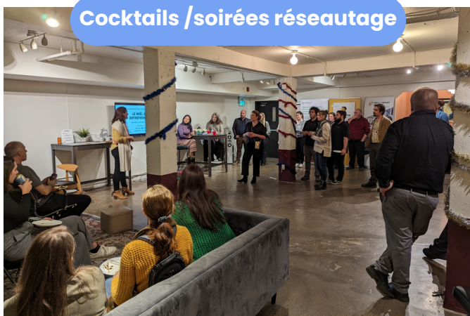
Cocktails / soirées réseautage